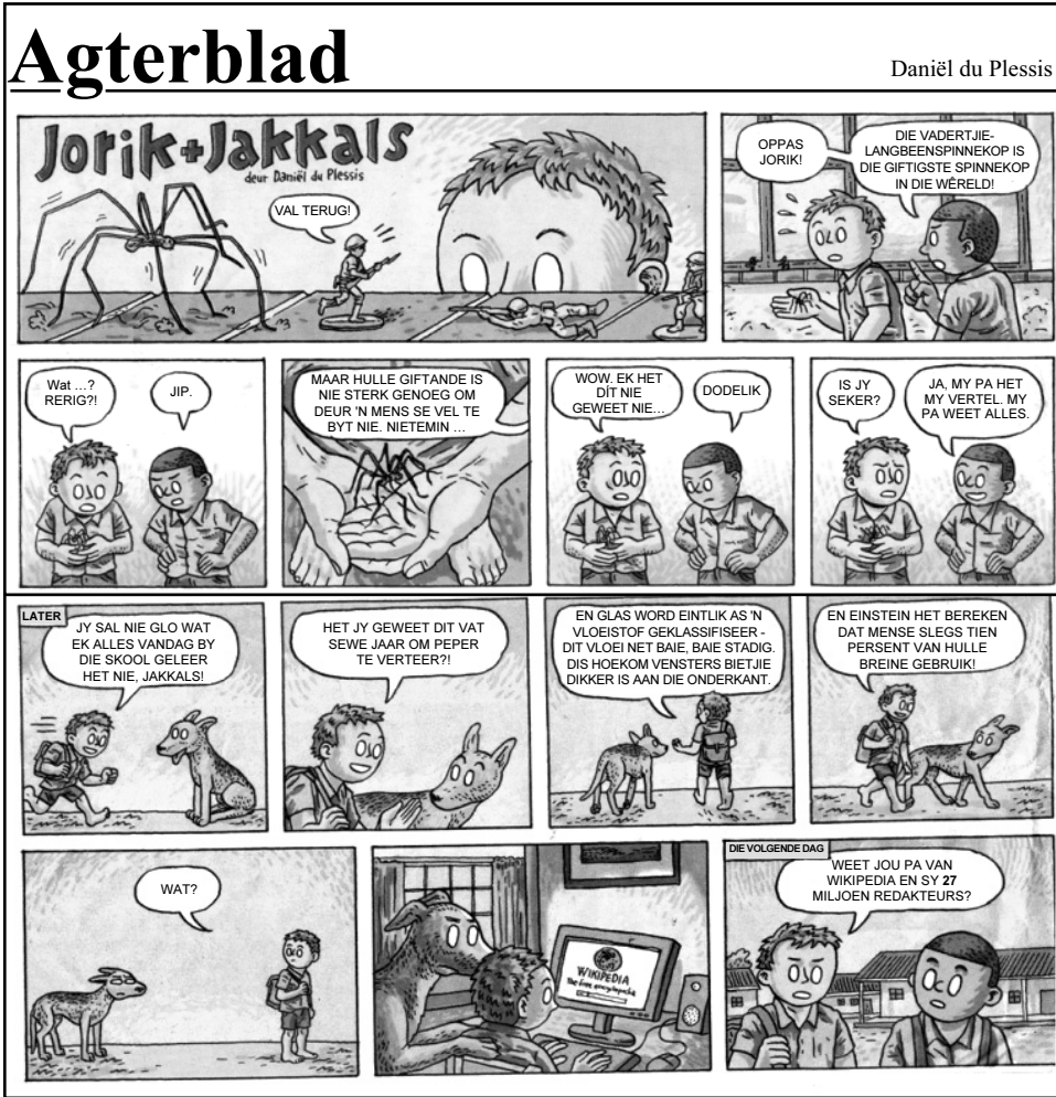
[Uit Rapport, datum onbekend]