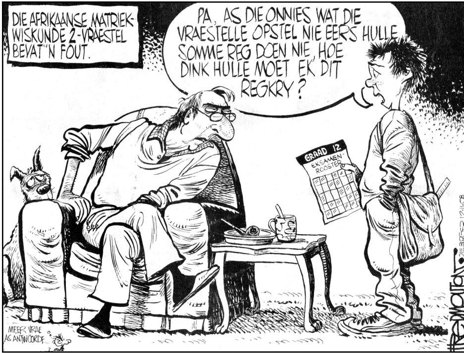
[Uit Die Burger, 12 November 2008]